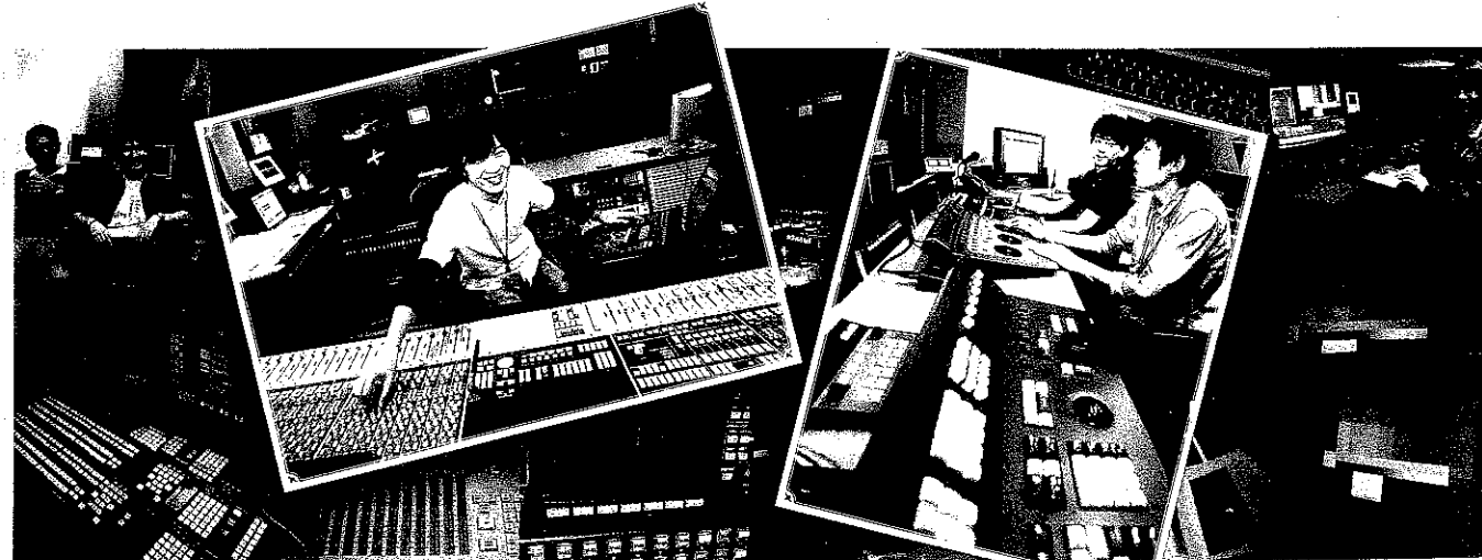
【撮影協力】(株)NHKメディアテクノロジー/(株)音響ハウス/(株)東京理研所/(株)ヒューマックスシネマ