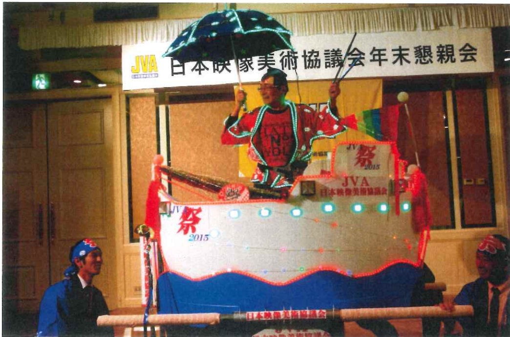
新光企画株式会社 辻本社長 電飾船にて 再入場