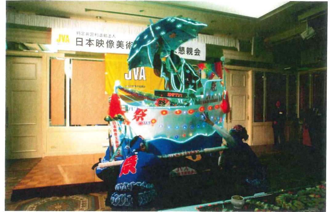
新光企画株式会社 辻本社長 電飾船にて 入場